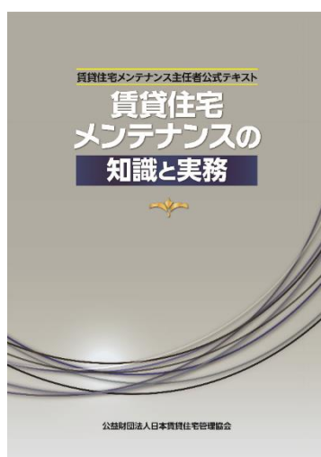
【公式テキスト表紙】