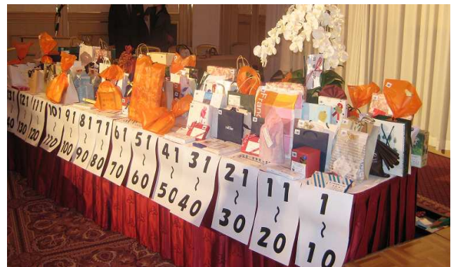
プレゼントの山！どれがもらえるかお楽しみ